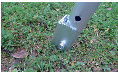
A punta per terreni soffici Spade-shaped end for soft ground