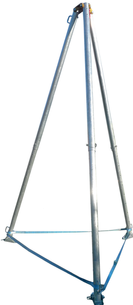
Tipo CT3 - 500 kg