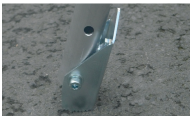
Zigrinata per superfici sdrucciolevoli (solo il modello da 250 Kg) Notched side for slippery surfaces (only 250 Kg model)