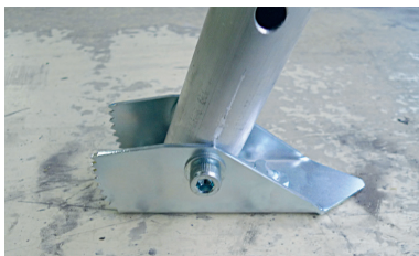
Con base piatta per superfici lisce Flat side for smooth surfaces