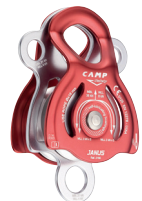
JANUS CA2160 CA2161 PRO