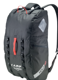
HOLD - 40 L CA2789