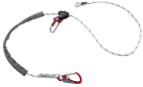
ROPE ADJUSTER CA2031.17