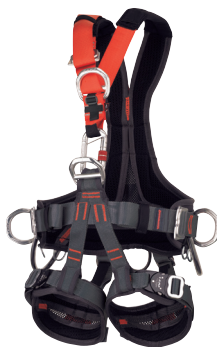
GOLDEN TOP EVO ALU CA941.02.L CA941.02.XL