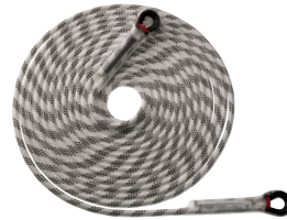
IRIDIUM 11 MM WITH LOOPS CA2811A005 - CA2811A010 CA2811A015 - CA2811A020 CA2811A030 - CA2811A040 CA2811A050 - CA2811A060