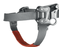
TURBOFOOT CA2258 DESTRA CA2259 SINISTRA