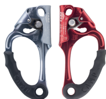
PILOT CA547 DESTRA CA547.01 SINISTRA