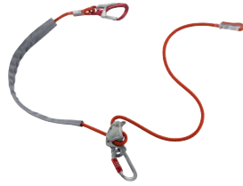
DRUID LANYARD CA2097.01