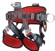
GT SIT CA2165.L CA2165.XL