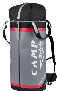
SUPERCARGO - 70 L CA2775