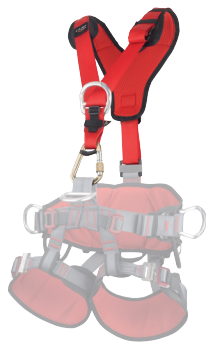
GT CHEST CA2166.L CA2166.XL