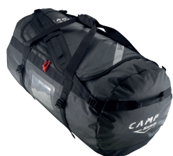
SHIPPER - 90 L CA2791