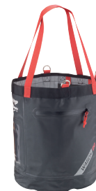
WAGON - 10/20 L CA2783 - CA2784