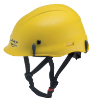
SKYLOR PLUS CA209.RO - CA209.GI CA209.BI - CA209.AR CA209.NE