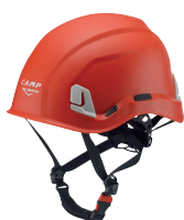
ARES CA0747.GI CA0747.RO CA0747.BI