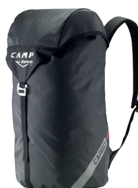
CARGO - 40 L CA2785