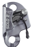
SOLO 2 CA2257 CA2257.01 NERO