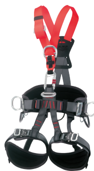
GOLDEN TOP PLUS ALU CA941.01.L CA941.01.XL